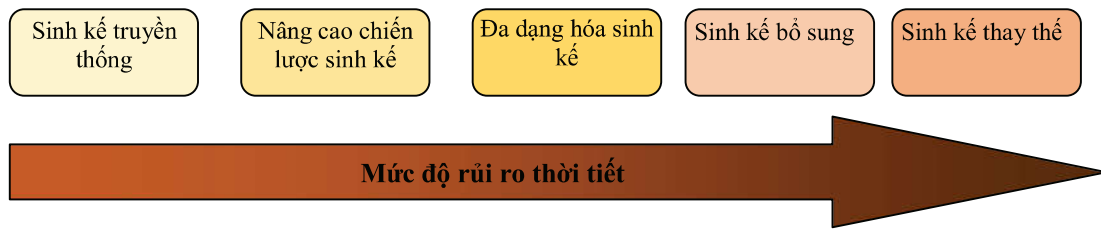
Hình 2: Mối liên hệ giữa chiến lược sinh kế và rủi ro thời tiết

Nguồn: Kế thừa nghiên cứu của Claire, 2004